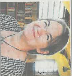
FORSTANDER LØGUNKLOSTER REFUGIUM HELLE SKARUP