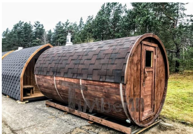
Et eksempel på en saunatønde, som bygges i bæredygtige naturlige materialer.