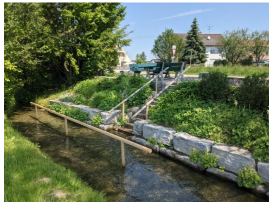
Tv. eksempel på 'kneipp-terapi', hvor det kolde vand stimulerer blodkredsløbet. Th. eksempel på udformning af vandtrappe og gelænder i vandløb til afprøvning af 'Kneipp-terapi'.