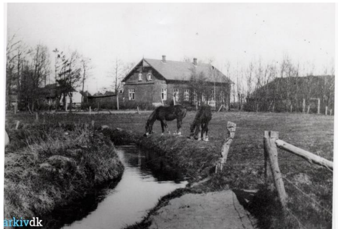
Th. ses Starup Bæk 1930.