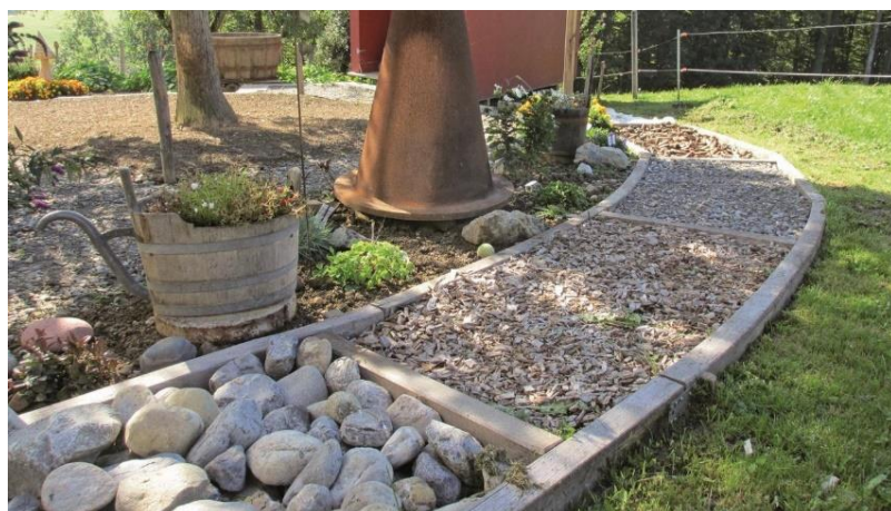
Tv. Ses et eksempel på pergolaer med roser og bænke. Th. et eksempel på en føle-sansesti.

Aktiviteter i tilknytning til 'Håbets Have', orangeriet og engene: