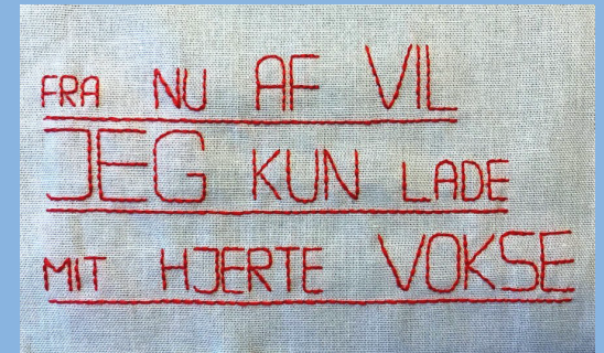
FØLSOMT BRODERI AF KRIS JENSEN

Pris pr. person: 4300 kr. i dobbeltværelse; 4600 kr. i enkeltværelse.