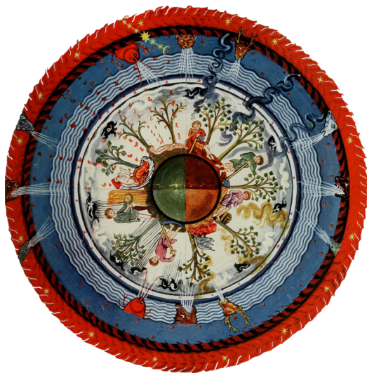
Hildegard af Bingen. En af 1200-tallets store influencere. Kvinde, nonne, kunstner, musiker. Optaget af VIRIDITAS. Et begreb, der peger på grønhed, vækst, heling. Ikke blot i planter, men i mennesker. I liv.