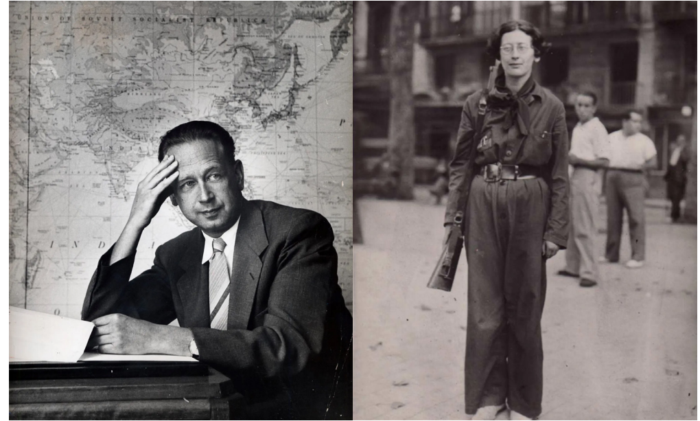
DAG HAMMARSKJÖLD 1905-1961 FN-generalsekretær, fjeldvandrer, mystiker.

Pris pr. person: 4300 kr. i dobbeltværelse; 4600 kr. i enkeltværelse. En dag mere + 500 kr.