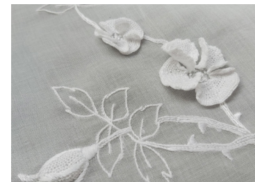
BRODERI I 3D