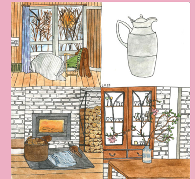
AT TEGNE LIV